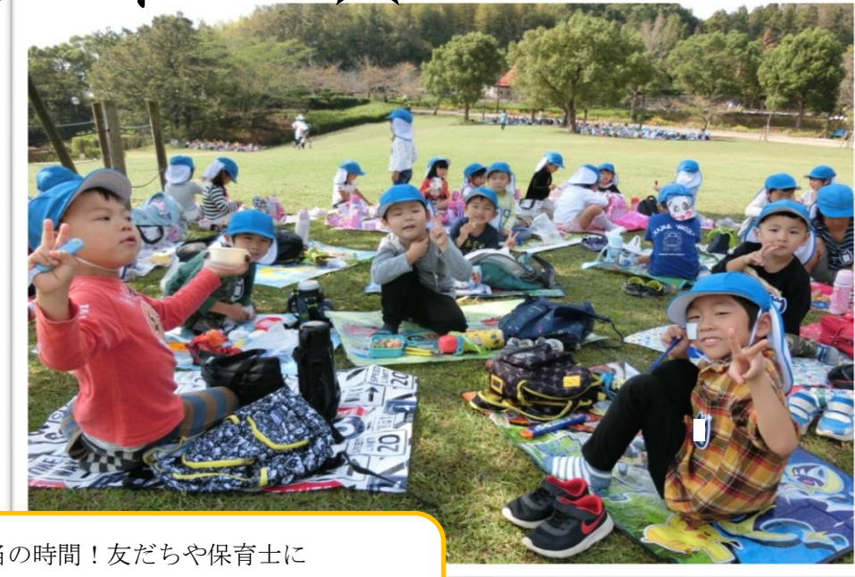
子どもたちが1番楽しみにしていたお弁当の時間！友だちや保育士に「みてみてー」、「おいしいよ〜」、「すごいでしょー」と見せて嬉しそうでした。朝早くから準備して頂き、ありがとうございました。