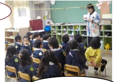
シルエットクイズ