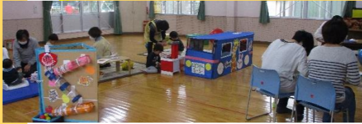
クリスマスクラフト

今年度より単発講座の時に、更生保護女性会の方が託児をしてくださり安心して講座に参加することができました。講座は楽しめたのですが、もう少し参加人数が増えるといいです。会員数自体なかなか増えなかったので、PRの仕方を検討していく必要があります。