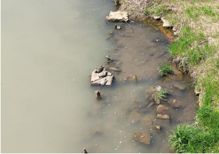
4月8日(金) 晴れ 気温20℃ 亀が日向ぼっこをしていました。 川が濁っていました。