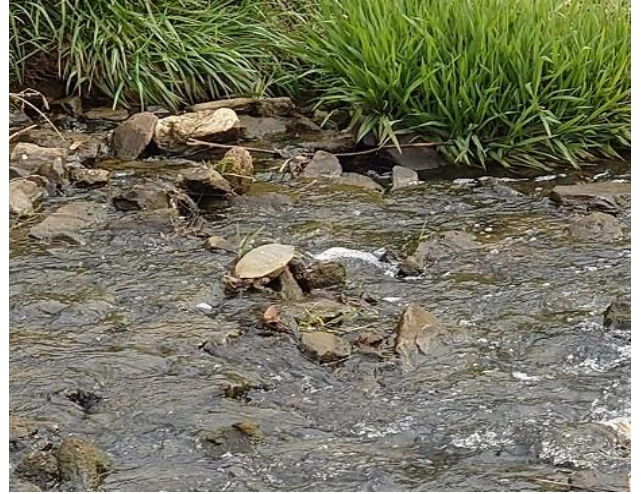
5月6日(金) 曇 気温24℃ 大きなアカミミガメがいました。