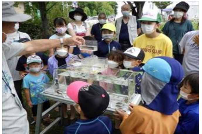
6月18日(土) 曇 明德寺川で自然観察会を実施しました。 採取したものを水槽に入れ、種類ごとにどんな生き物なのか説明がありました。 特に外来生物、特定外来生物について、なぜ日本に入ってきたのか、なぜこんなに増えてしまったのか等、説明がありました。