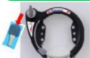
シリンダー式脚錠