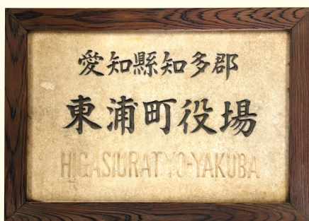
旧東浦町役場門標

郡長から内示された合併案に対し、藤江村では有協(現半田市)・藤江・生路・石浜の4か村を1村とすると決議した。