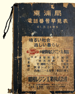
東浦局電話番号早見表 1966年(昭和41) 個人蔵