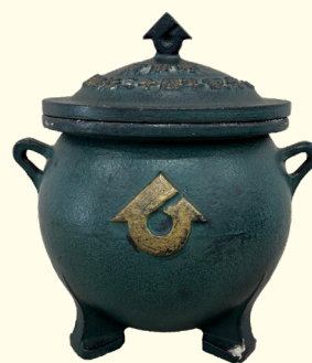
タイムカプセル模型 1979年(昭和54)個人蔵 町制30周年を記念して、緒川城址にタイムカプセルを埋設した。開封は町制100年目にあたる2048年。