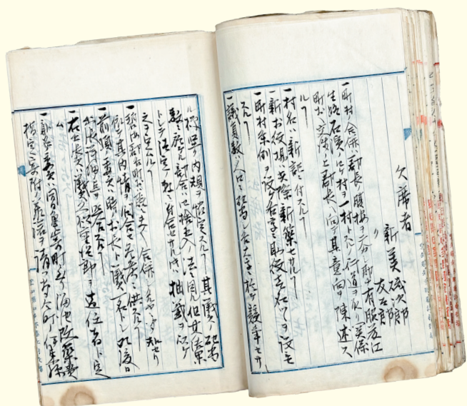
協議案並決議録 1905年(明治38)11月

1906年(明治39)、森岡・緒川・石浜・生路・藤江の五か村が合併し東浦村が誕生しました。合併から120年、昭和も満100年となりました。東浦村ができた頃から戦争と敗戦、高度経済成長を遂げた激動の昭和時代まで、時代の変化とともに東浦もそのすがたを変えてきました。本企画展では、町の基盤となる事柄をとりあげ、その変遷をたどりながら、明治時代の終わりから昭和時代の東浦の出来事を紹介します。