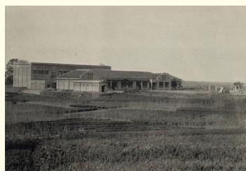
生路尋常小学校校舎 1926年(大正15)