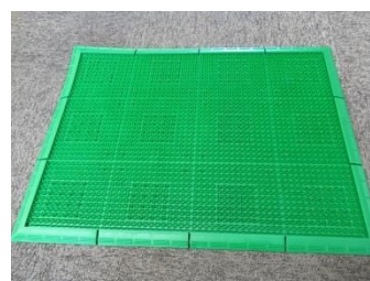
種子を落とすマット