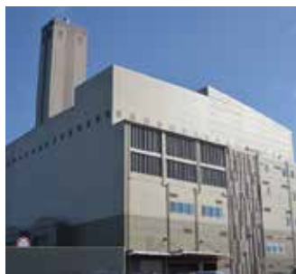
東部知多クリーンセンター