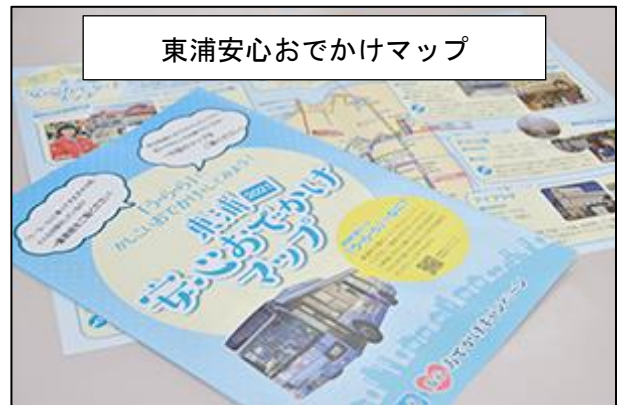
東浦安心おでかけマップ