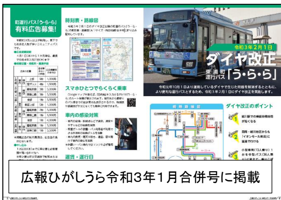
広報ひがしうら令和3年1月合併号に掲載

令和3年1月からイオンモール東浦の大型サイネージ及び小型サイネージにダイヤ改正の周知記事を投影した。