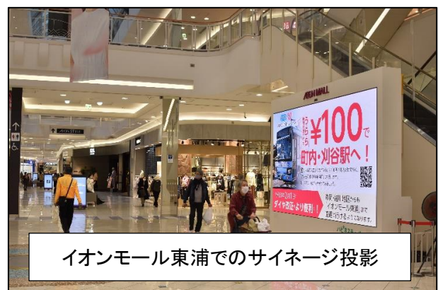
イオンモール東浦でのサイネージ投影