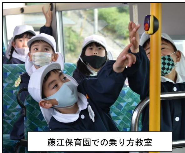
藤江保育園での乗り方教室