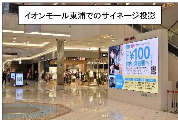
イオンモール東浦でのサイネージ投影

「う・ら・ら」の防疫対策や町内の商業施設の混雑状況等を掲載した小冊子を印刷し、広報ひがしうら令和3年4月号に折り込み全戸配布した他、イオンモール東浦やげんきの郷等の協力店舗のラックに配架した。