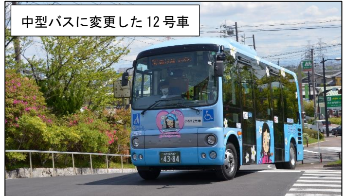
中型バスに変更した12号車