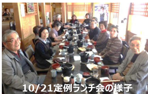
10/21定例ランチ会の様子