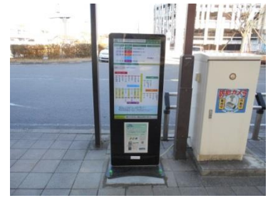
緒川駅東口（屋外サイネージ）