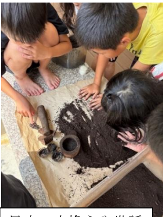
昆虫の土換えや世話

異年齢同年齢のお子さんの触れ合いの場、パパママの交流の場。子どもの発達に合わせた活動も取り入れます。