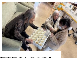
敬愛苑交流会もちつき会