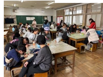
コミュニティ祭り