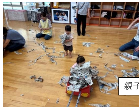
親子触れ合い遊び