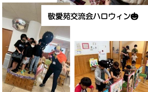
敬愛苑交流会ハロウィン🎃