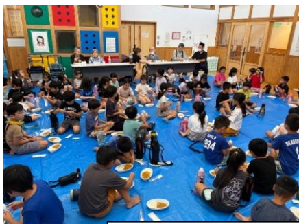
町のカレー屋さん

わが子が大きくなった時、いつどこでどんな事態が起こっても、一人で生きていく力を身につけてあげること。その為に大切なのは、生活力・コミュニケーション能力・問題解決力だと思っています。これを育てることを心に留めながらお子さんと関わってほしい、関わっていきたくと思っています😊