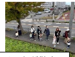
親子で手つなぎ散歩