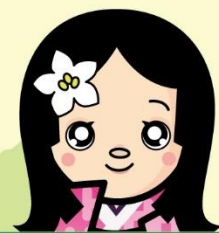
東浦町マスコットキャラクター 家康の母・於大の方 おだいちゃん