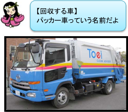
【回収する車】パッカー車っていう名前だよ