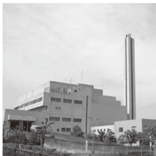
東部知多クリーンセンター