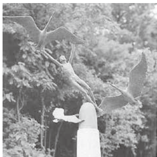
知北平和公園「彫刻の森」