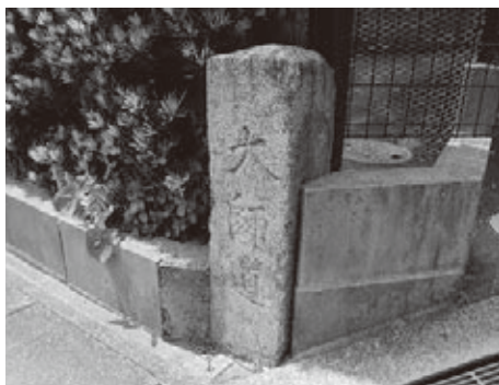
うのはな館(郷土資料館)