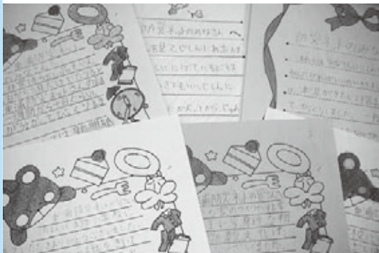
小中学生が書いた防災ネットへの感想文

現在、南海トラフ巨大地震の被害想定が出されています。地震に対する備えがしっかりできていれば、その数字を8割減らすことができるという方もいます。