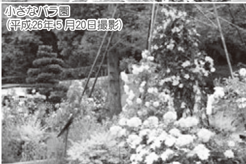
小さなバラ園 (平成26年5月20日撮影)

10月～5月：午前9時～午後3時 6月～9月：午前9時～午後4時 ※予約はできませんが、団体で利用する場合は、このはな館へ事前連絡をお願いします。