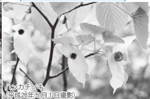
ハンカチノキ (平成26年5月1日撮影)