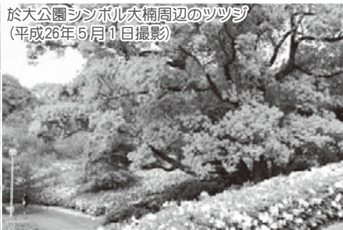
於大公園シンボル大楠周辺のツツジ (平成26年5月1日撮影)