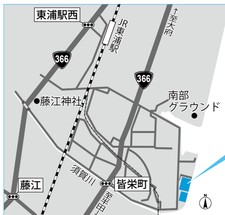
東浦みどり浜緑地 多目的広場