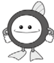
下水道マスター 「スィスイ」

● とき 2月16日(火) 午前8時30分 午後5時15分 ～3月1日(火) ● ところ・問い合わせ 上下水道課 内線136