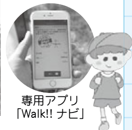
専用アプリ 「Walk!! ナビ」