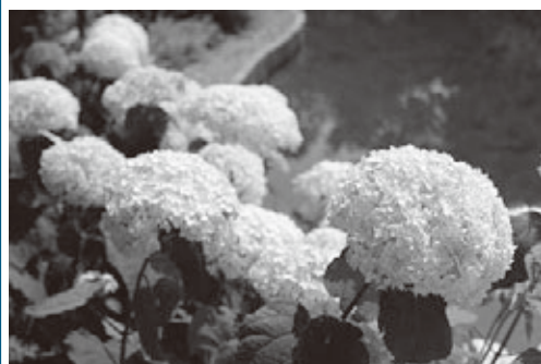
平成26年6月15日 アジサイ（アナベル）