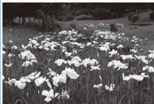
平成26年6月11日 しょうぶ 菖蒲園