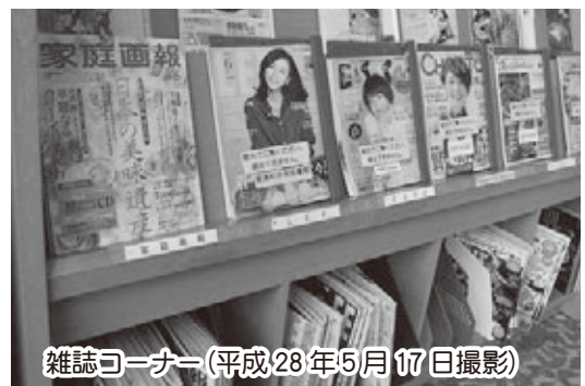
雑誌コーナー(平成28年5月17日撮影)

答 雑誌の最新号は、以前から心無い人による無断での持ち出しが相次いでおり、やむを得ずカウンター内への取り込みをしておりました。しかしながら、多くの方にご不便をおかけしておりますので、平成28年4月以降、カウンターへの取り込みをやめて、他の雑誌同様、自由に閲覧できる状態にさせていただきます。利用者の利便性とマナーのバランスは常に苦慮しているところですが、利用者の皆さんに満足していただけるよう努力してまいります。