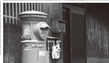
善導寺 白壁の塀 レトロな郵便ポスト