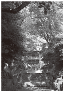
越境寺 新緑のトンネル