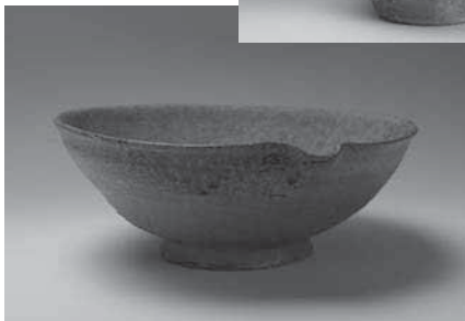
かたぐちばち片口鉢