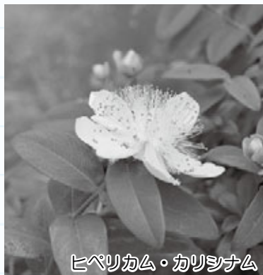
ヒペリカム・カリシナム

今年度は、毎月15日号で於大公園の風景を紹介します。於大公園の四季折々の表情をお楽しみください。