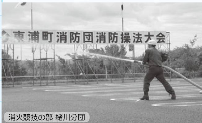
消火競技の部 緒川分団

イオンモール東浦南側駐車場で第44回消防団操法大会が開催されました。団員の皆さんは日頃の訓練の成果を存分に発揮していました！