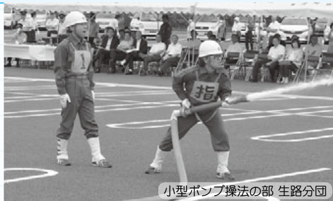
小型ポンプ操法の部 生路分団