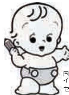
国勢調査 イメージキャラクター センサスくん

調査員が9月10日からインターネット回答のための書類を配布しますので、9月20日までにインターネットでの回答をお願いします。