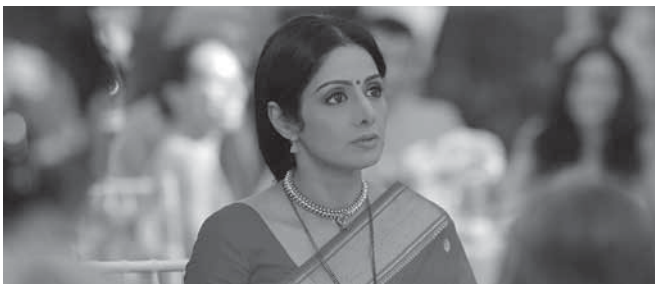
『マダム・イン・ニューヨーク』

ビジネスマンの夫と2人の子ども、裕福な暮らしを送る主人公の女性シャンだが、家族の中で一人だけ英語が話せない。家族からからかわれて傷つく毎日。そんな彼女が一人ニューヨークへ。様々な人との関わりのなかで変わっていく。