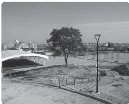
三丁公園供用開始

平成27年度一般会計決算は、前年度に比べ歳入では3億2,967万3千円の増、歳出では1億7,746万1千円の増となりました。