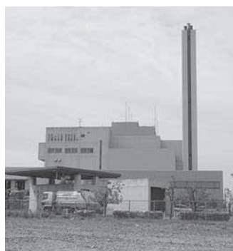
東部知多クリーンセンター