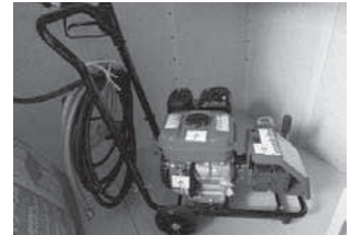
エンジン高圧洗浄機