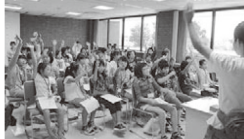
子どもスタッフによる話し合いの様子