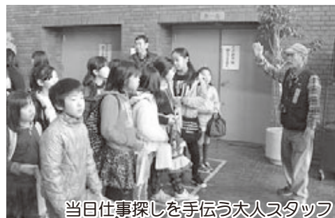
当日仕事探しを手伝う大人スタッフ