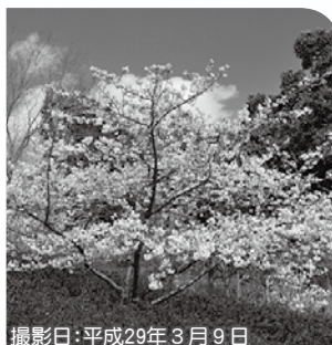
撮影日：平成29年3月9日