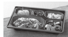
健康ボリューム食

(注1) …6月1日から、「宅配クック123」の普通食に「健康ボリューム食」が追加されます。おかずの量は「宅配クック123弁当」の1.3倍(グラム数)、カロリーはご飯付きで680キロカロリー以下です。料金は住民税非課税世帯が400円、住民税課税世帯が500円です。