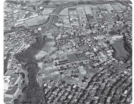
東浦上割木土地区画整理事業

今後もハード、ソフト両面にわたり、町民の皆さんの期待にお応えできるよう努力します。