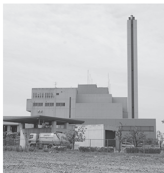
東部知多クリーンセンター