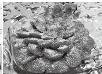
フィリピン クチンタ (スイーツ)