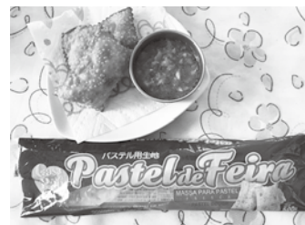
ブラジル パステル (ホットスナック)

12月10日(月)～平成31年1月18日(金)に申込用紙をファックス、メール、郵送(当日必着)または直接問い合わせ先へ