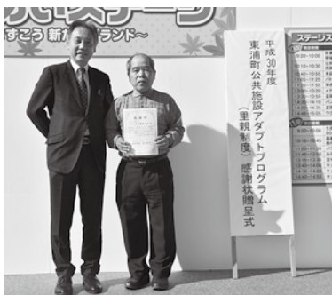
アンズ 公園友の会