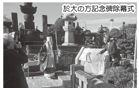
於大の方記念碑除幕式