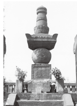
於大の墓(東京都小石川傳通院)

於大の故郷緒川村の善導寺では、徳川の権威がなくなった明治時代にも寺と檀家が中心となって於大の三百回忌法要を行った、という記録が残っています。また、東浦町観光協会が墓所の傳通院に於大の方記念碑を建立し、平成30年11月17日に除幕式を行いました。東浦の人びとの中には今も、於大を思う心が生き続けているのです。