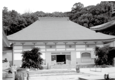
建設中の宇宙山乾坤院本堂