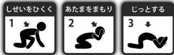
シェイクアウト訓練

「緊急地震速報チャイム音」「緊急地震速報、大地震です。大地震です。これは、訓練放送です」×3回