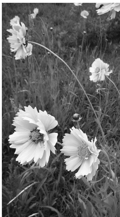
花の詳細はホームページへ