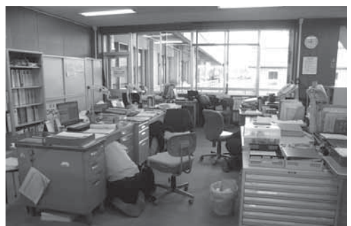
昨年の役場での様子