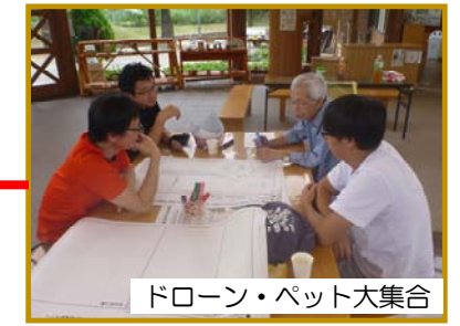
ドローン・ペット大集合