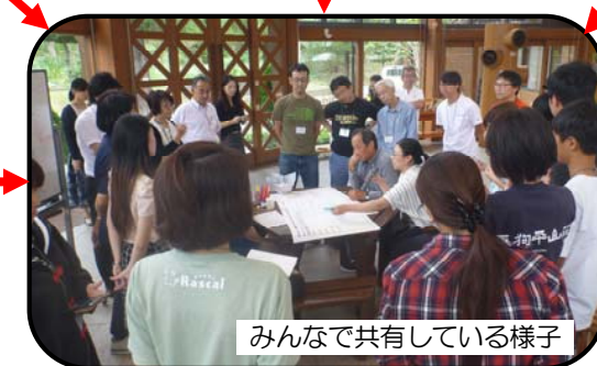
みんなで共有している様子