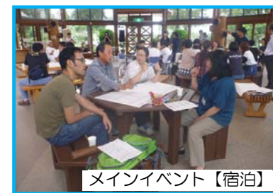
メインイベント【宿泊】

その後、各グループで話し合った内容を各々発表して頂き、イベントの大まかな内容を全員で共有しました。