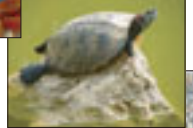
■ミシシッピアカウミガメ