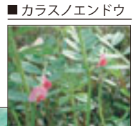
■カラスノエンドウ