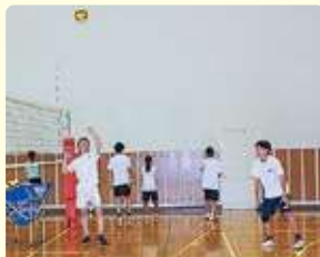
バレーボールクラブ (北部中学校 体育館)