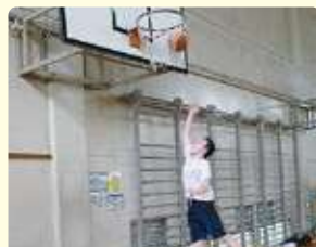
バスケットボールクラブ (東浦中学校 体育館)