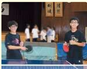
卓球クラブ (東浦中学校 飛翔館)