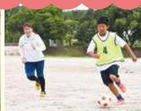
サッカークラブ (東浦中学校 グラウンド)