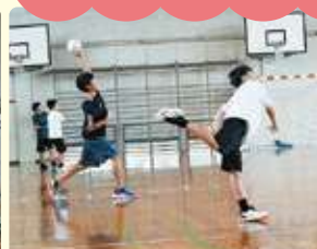
ハンドボールクラブ (東浦中学校 体育館)