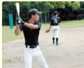
軟式野球クラブ (北部中学校 グラウンド)