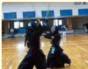
剣道クラブ (東浦中学校 飛翔館)