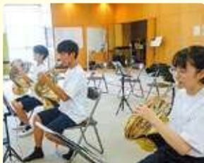
吹奏楽クラブ (西部・北部・東浦中学校)