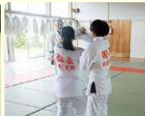
柔道クラブ (北部中学校 武道場)