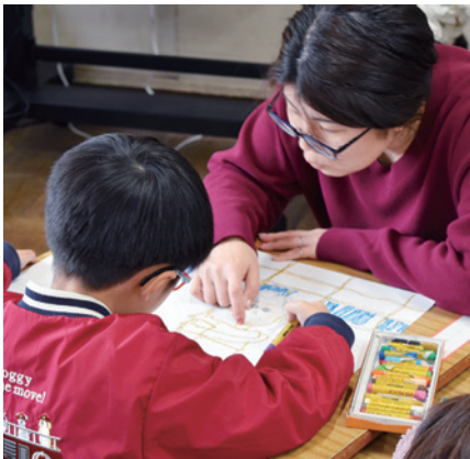
▲片葩小学校の授業風景

教員像の実現には、心身の健康が非常に重要である。持続的に学びや成長を支えるには、自身の健