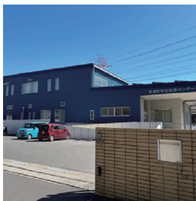
▲小中学校へ給食を調理配送している東浦町学校給食センター

また、コミュニティソーシャルワーカーによる積極的な働きかけを実施している。加えて民生委員・児童委員等に本事業の周知を進め、支援が必要な方へ確実に届くよう取り組んでいる。