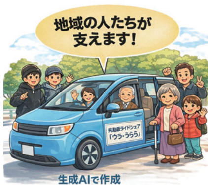
▲共助版ライドシェアは住民が運転手として移動を支えます。