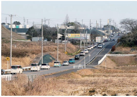
▲朝渋滞中の町道森岡藤江線 緒川相生交差点方面(令和8年2月12日撮影)

A 朝夕の渋滞を確認した。渋滞の主な要因は、町内の幹線道路が東西方向と南北とも不足しており、交通が特定の道路に集中していること。抜本的な渋滞対策として、都市計画道路大府東浦線の整備が必要。未整備区間の早期の整備着手を県に強く要望していく。