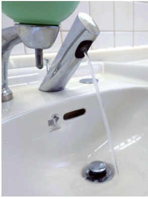
▲安心して使える水道料金の設定に

人口減少等で給水収益等の減少や施設の耐震化、老朽化対策等、水道事業は年々厳しさを増している。本町では、13年度には経常収支が赤字に転じる見込み。これらを踏まえ、安定的かつ持続的な事業経営のため、可能な限り早期の料金改定が望ましいと考える。