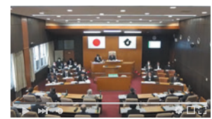
▲ YouTube ライブ開始しました