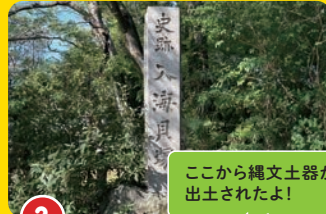
2 入海貝塚 いりみかいづか