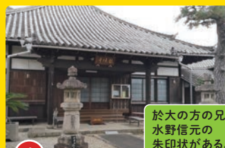
4 越境寺 おつきょうじ