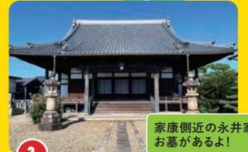
3 了願寺 りょうがんじ