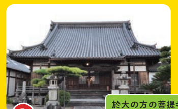
5 善導寺 ぜんどうじ