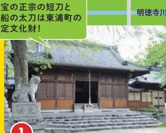
1 入海神社 いりみじんじや