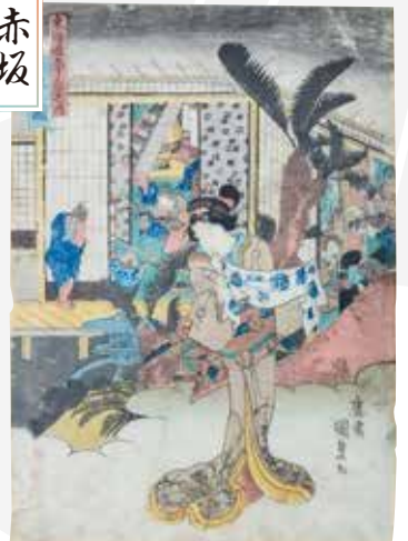
東海道五十三次之内 赤坂ノ図 歌川国貞 佐野屋喜兵衛版