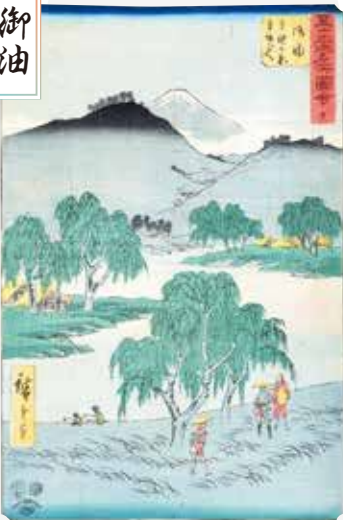
五十三次名所図会 御油 歌川広重 蔦屋吉蔵版