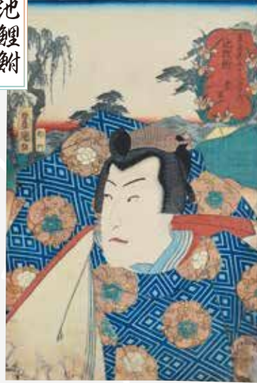
東海道五十三次の内 池鯉鮒 三代歌川豊国 伊勢屋兼吉版