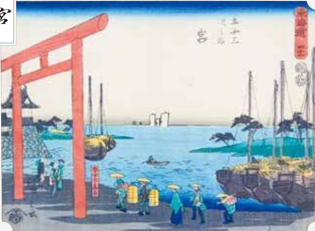
東海道四十一 五十三次之内 宮 歌川広重 蔦屋吉蔵版