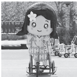
おだいちゃん自転車に乗る